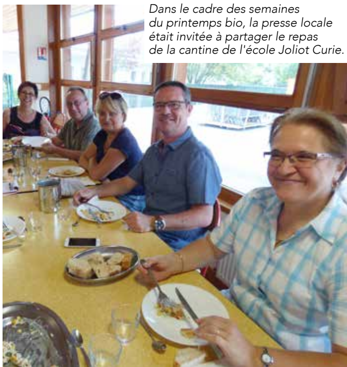
Dans le cadre des semaines du printemps bio, la presse locale était invitée à partager le repas de la cantine de l'école Joliot Curie.