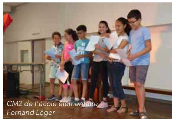
CM2 de l'école élémentaire Fernand Léger