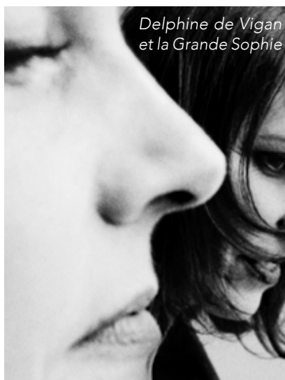
Delphine de Vigan et La Grande Sophie

billetterie@train-theatre.fr ou au 04 75 57 14 55.