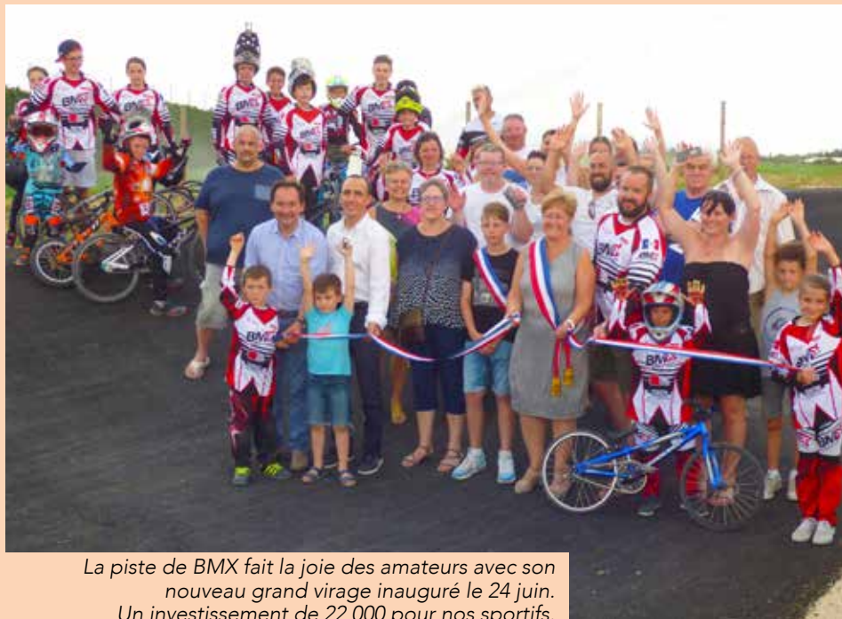
La piste de BMX fait la joie des amateurs avec son nouveau grand virage inauguré le 24 juin. Un investissement de 22 000 pour nos sportifs.