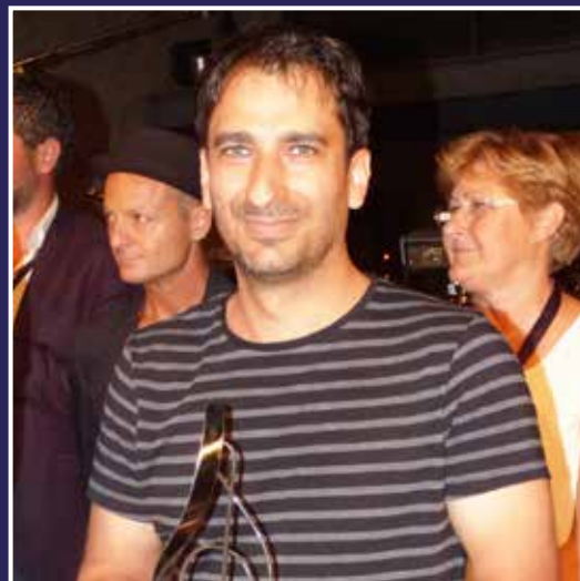
Catégorie auteurs compositeurs 1 er prix pour le groupe "Blake" de Montélier.