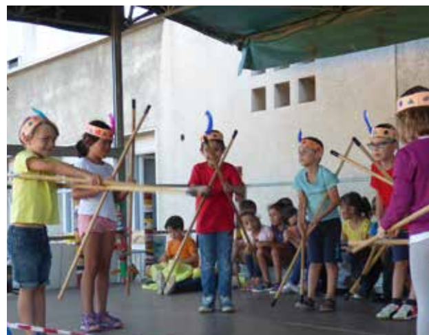
À Joliot Curie, les chants ont alterné avec des saynètes, comme ici à droite les indiens. Les parents ont beaucoup apprécié.