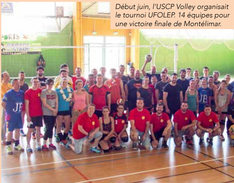
Début juin, l'USCP Volley organisait le tournoi UFOLEP. 14 équipes pour une victoire finale de Montélimar.