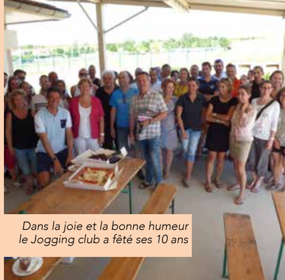
Dans la joie et la bonne humeur le Jogging club a fêté ses 10 ans