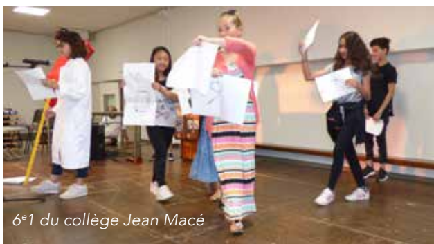
6 e 1 du collège Jean Macé