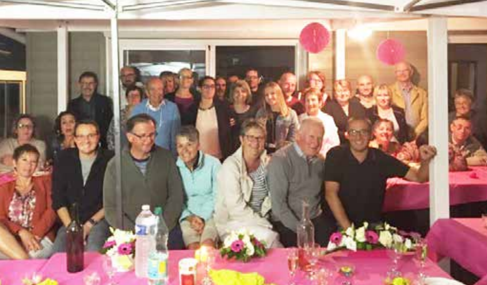
L'Association Flor'à vie a fêté ses 10 ans.