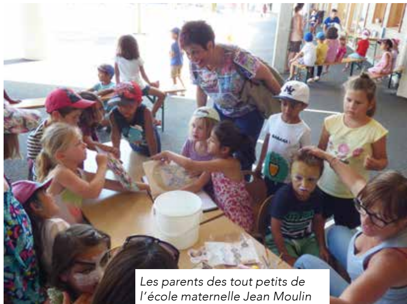
Les parents des tout petits de l'école maternelle Jean Moulin ont eu droit, le 19 juin dernier, à un spectacle chanté aux allures de savane africaine.