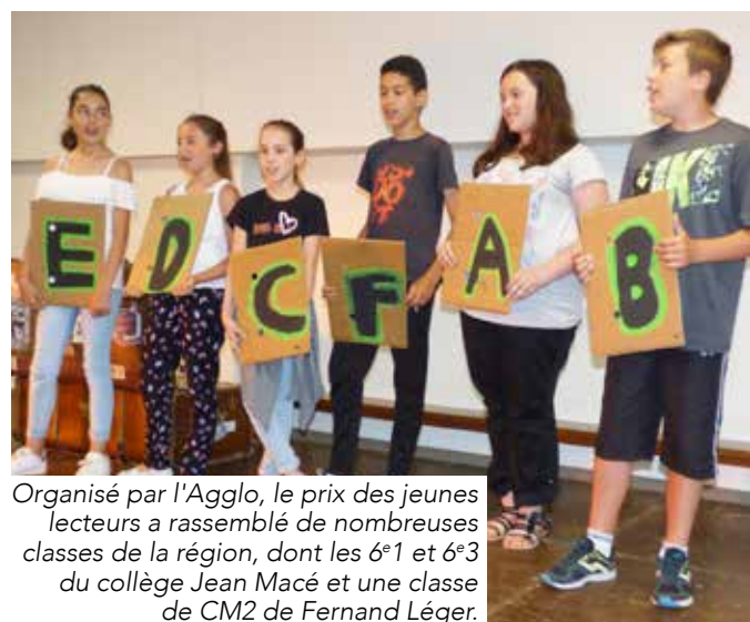
Organisé par l'Agglo, le prix des jeunes lecteurs a rassemblé de nombreuses classes de la région, dont les 6 e 1 et 6 e 3 du collège Jean Macé et une classe de CM2 de Fernand Léger.