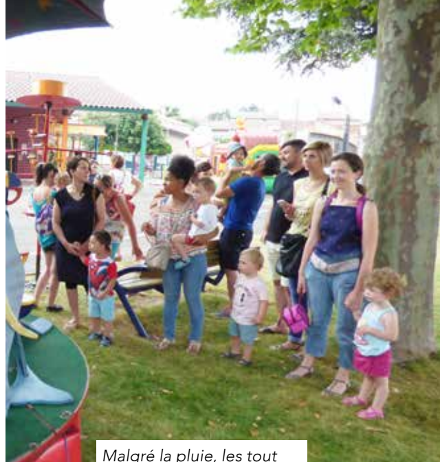
Malgré la pluie, les tout petits de la Pitchouline ont apprécié les manèges.