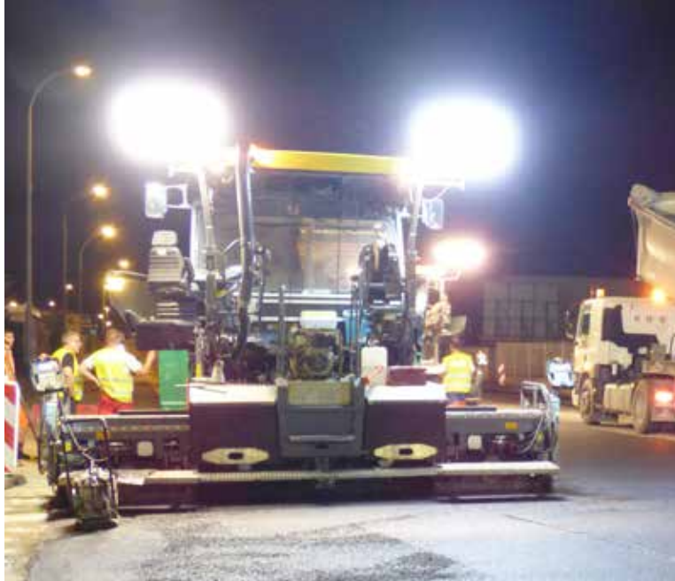
Depuis début juillet l'avenue président Salvador Allende est de nouveau ouverte à la circulation. (voir page 9)