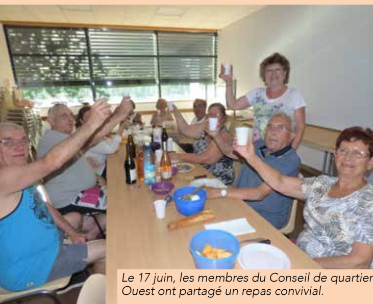
Le 17 juin, les membres du Conseil de quartier Ouest ont partagé un repas convivial.