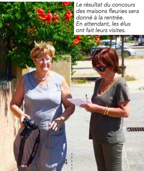
Le résultat du concours des maisons fleuries sera donné à la rentrée. En attendant, les élus ont fait leurs visites.