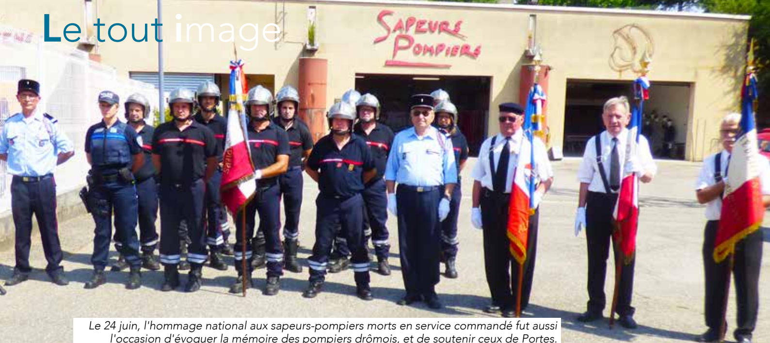
Le 24 juin, l'hommage national aux sapeurs-pompiers morts en service commandé fut aussi l'occasion d'évoquer la mémoire des pompiers drômois, et de soutenir ceux de Portes.