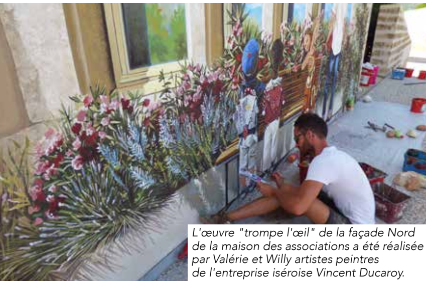
L'œuvre "trompe l'œil" de la façade Nord de la maison des associations a été réalisée par Valérie et Willy artistes peintres de l'entreprise iséroise Vincent Ducaroy.