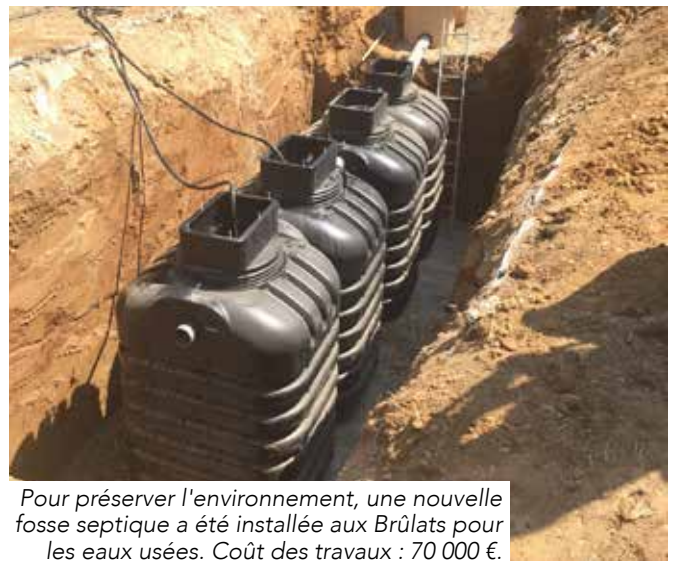
Pour préserver l'environnement, une nouvelle fosse septique a été installée aux Brûlats pour les eaux usées. Coût des travaux : 70 000 €.