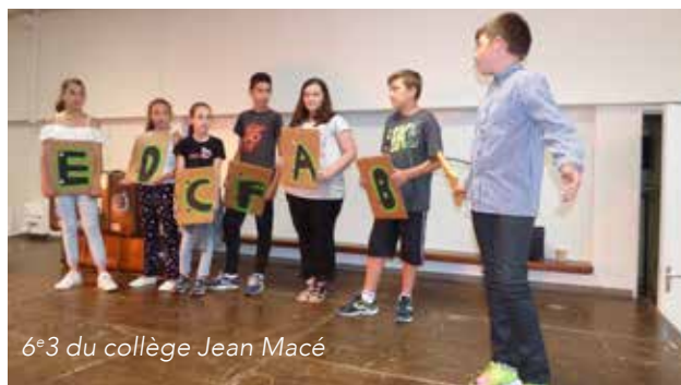
6 e 3 du collège Jean Macé