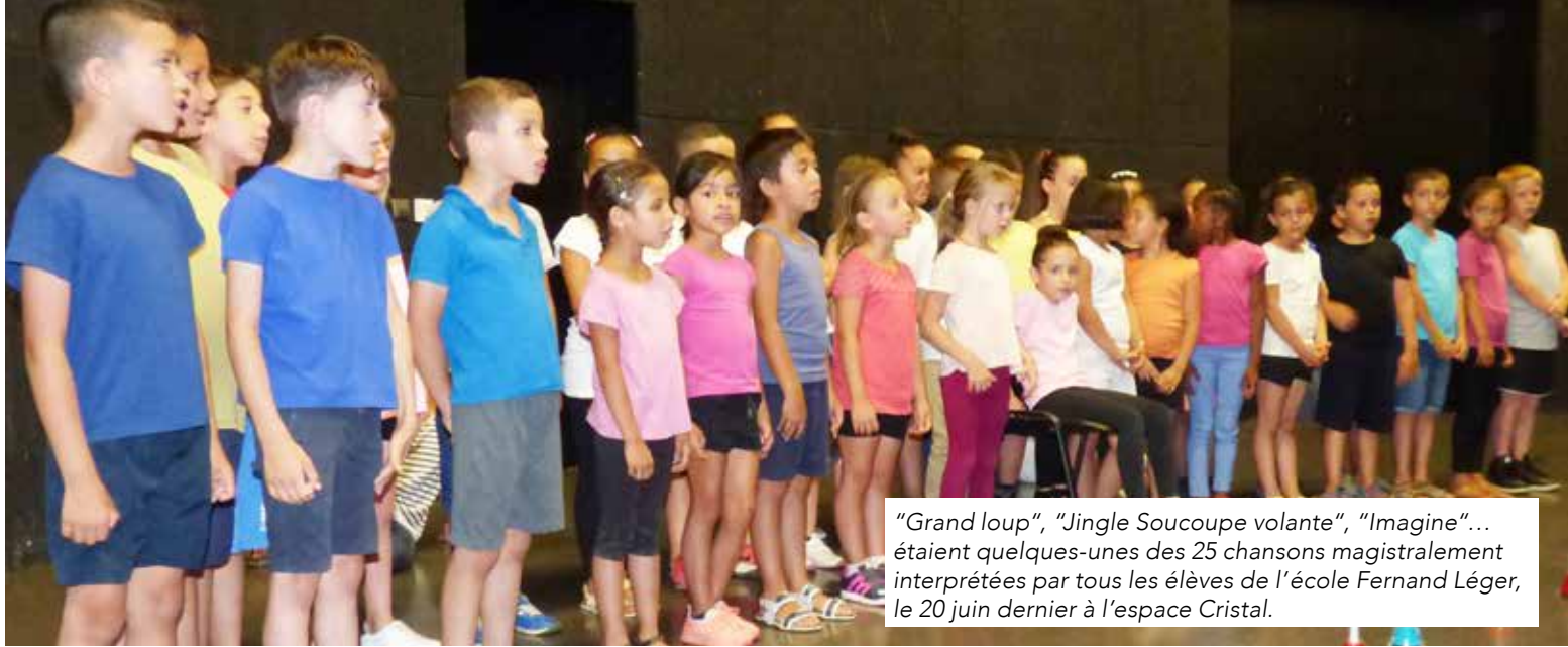
"Grand loup", "Jingle Soucoupe volante", "Imagine"... étaient quelques-unes des 25 chansons magistralement interprétées par tous les élèves de l'école Fernand Léger, le 20 juin dernier à l'espace Cristal.