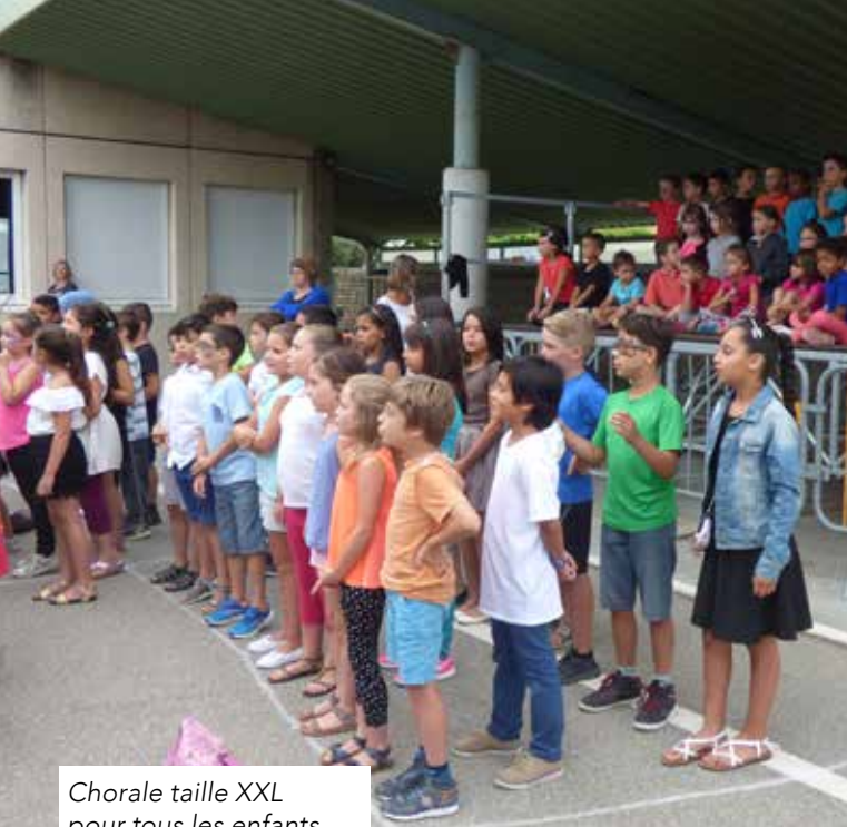
Chorale taille XXL pour tous les enfants de l'école élémentaire Voltaire. Félicitations aux professeurs !

"L'école est finie" aurait chanté Sheila... et comme toujours l'année s'est terminée en fêtes dans chacune des 7 écoles portoises. Spectacles, chants et expositions ont été préparés pendant des mois pour le plus grand plaisir des enfants, des parents et peut être aussi des professeurs. Bonnes vacances à tous !