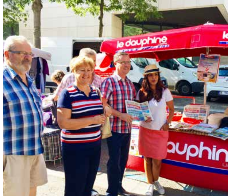
Le 13 juillet, le Dauphiné Libéré était présent sur le marché, au contact de ses lecteurs.