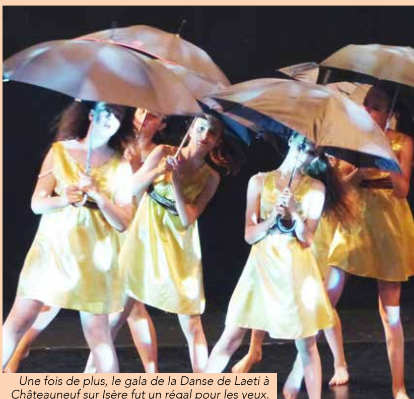
Une fois de plus, le gala de la Danse de Laeti à Châteauneuf sur Isère fut un régal pour les yeux.