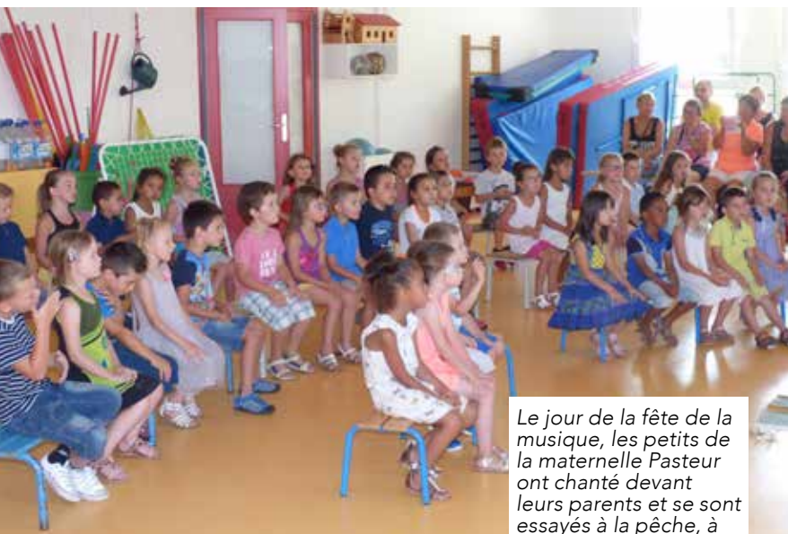
Le jour de la fête de la musique, les petits de la maternelle Pasteur ont chanté devant leurs parents et se sont essayés à la pêche, à la loterie et même au maquillage.