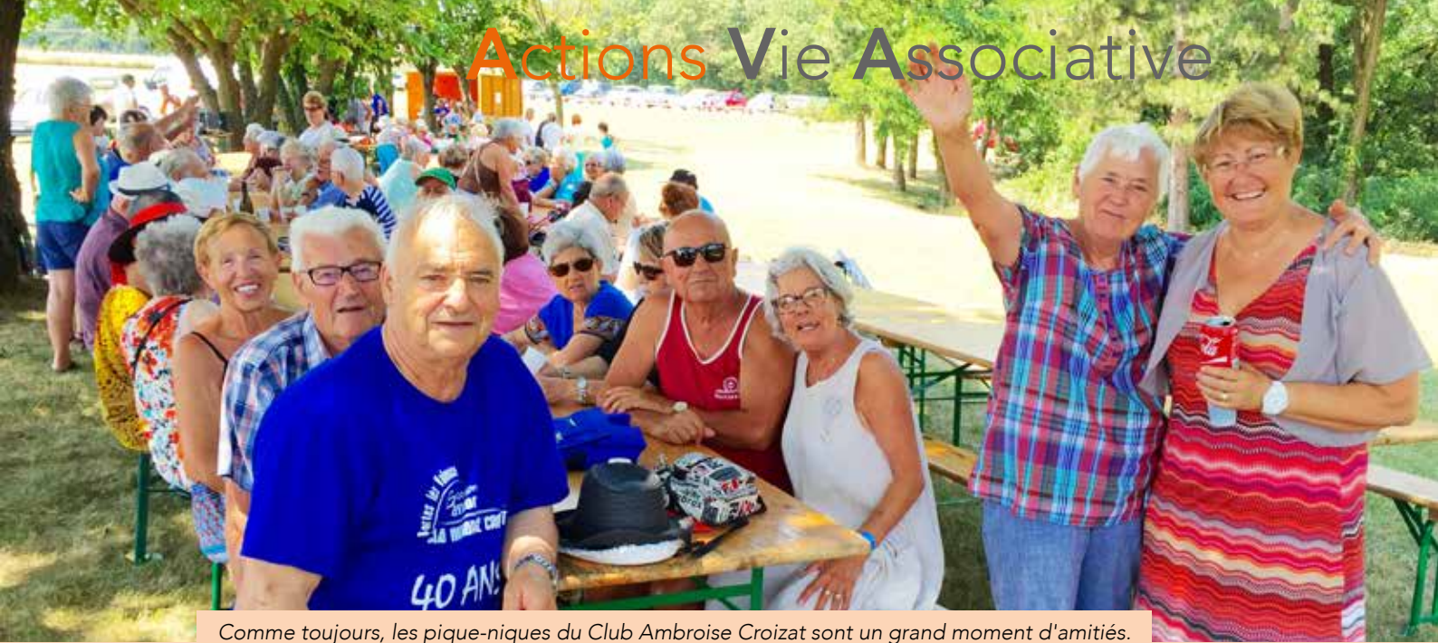
Comme toujours, les pique-niques du Club Ambroise Croizat sont un grand moment d'amitiés.