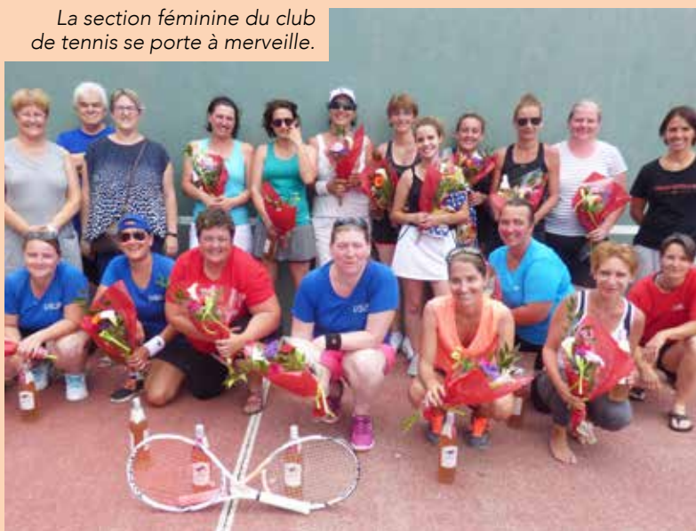
La section féminine du club de tennis se porte à merveille.