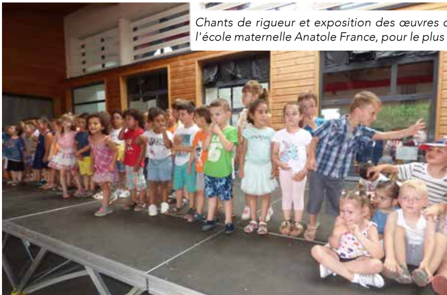
Chants de rigueur et exposition des œuvres de nos jeunes artistes de l'école maternelle Anatole France, pour le plus grand plaisir des parents.