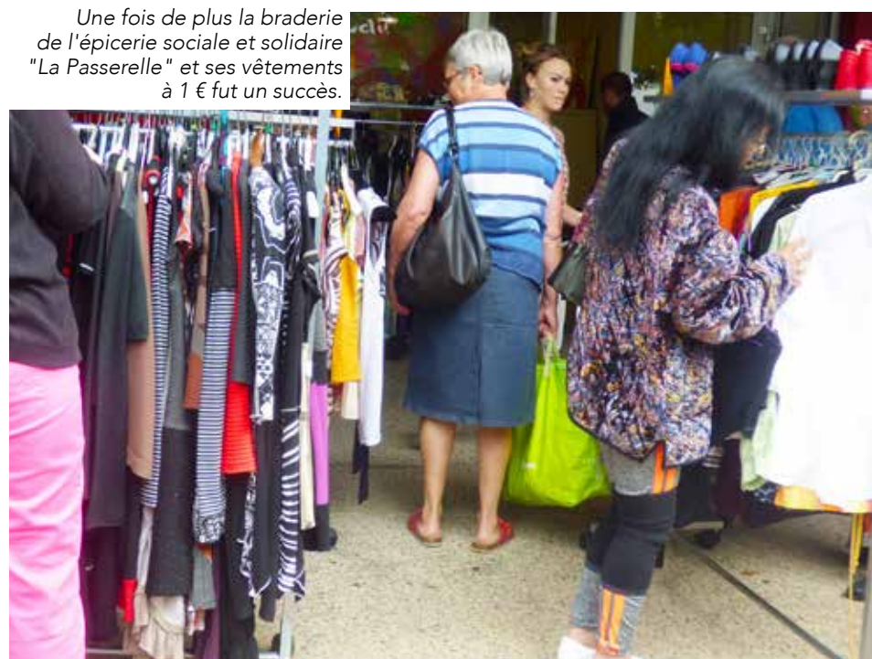
Une fois de plus la braderie de l'épicerie sociale et solidaire "La Passerelle" et ses vêtements à 1 € fut un succès.