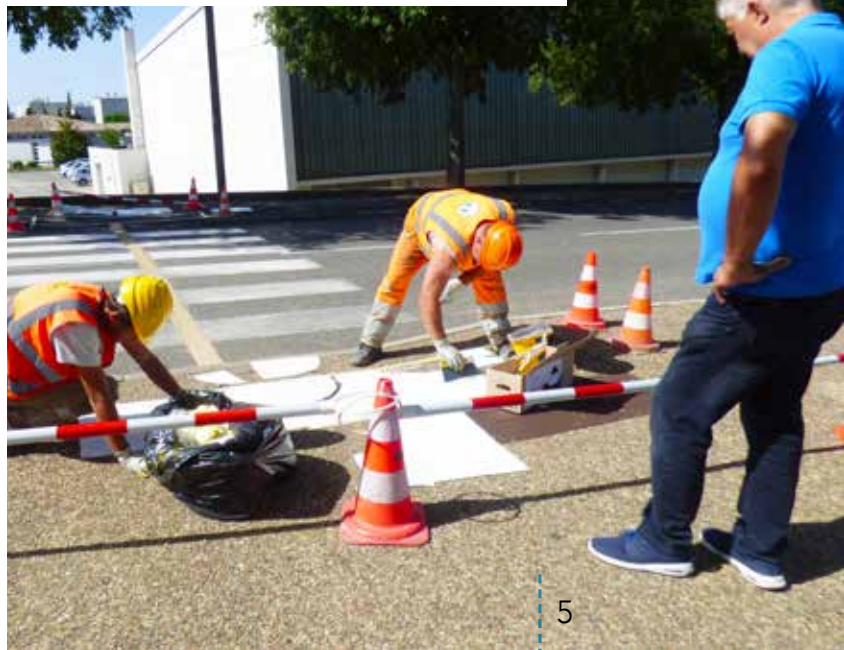
Tous les passages piétons de Portes sont peu à peu équipés de bandes destinées aux mal voyants.