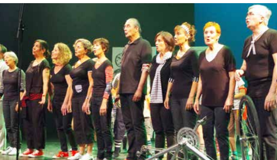
Le conte musical Pantin Pantine a marqué l'année de l'école de musique intercommunale. Le 11 juin, il faisait étape au Train-Théâtre.