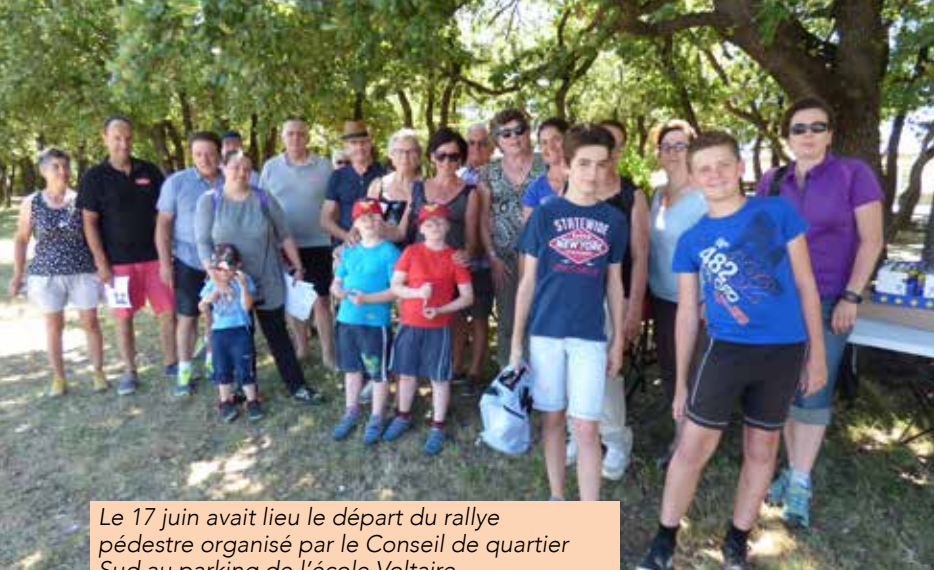
Le 17 juin avait lieu le départ du rallye pédestre organisé par le Conseil de quartier Sud au parking de l'école Voltaire.