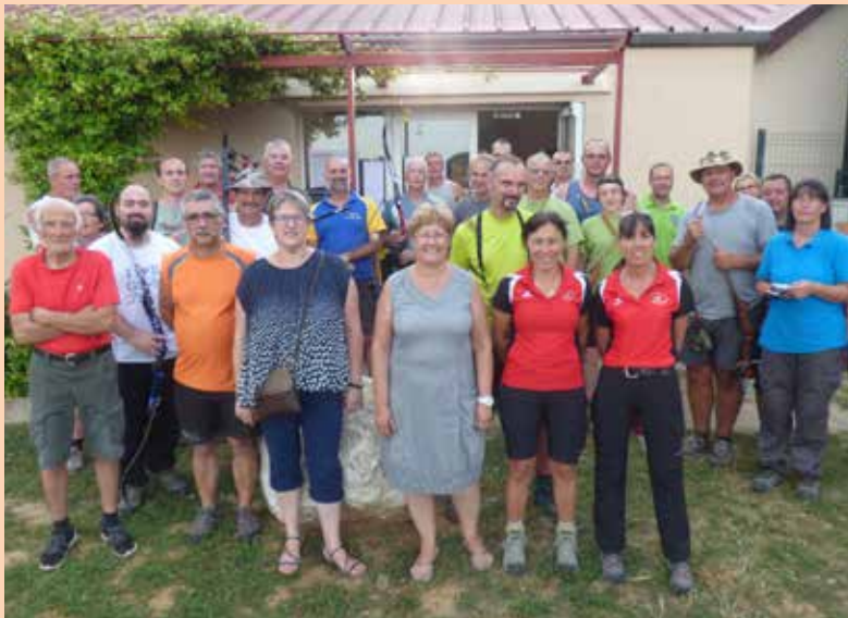
Les 24 et 25 juin derniers avait lieu le concours 3D de tir à l'arc, aux Brûlats, organisé par La flèche sous bois. L'occasion d'accueillir des clubs venus de toute la région.