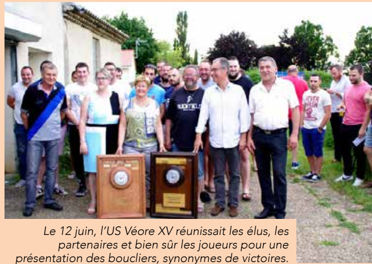
Le 12 juin, l'US Véore XV réunissait les élus, les partenaires et bien sûr les joueurs pour une présentation des boucliers, synonymes de victoires.