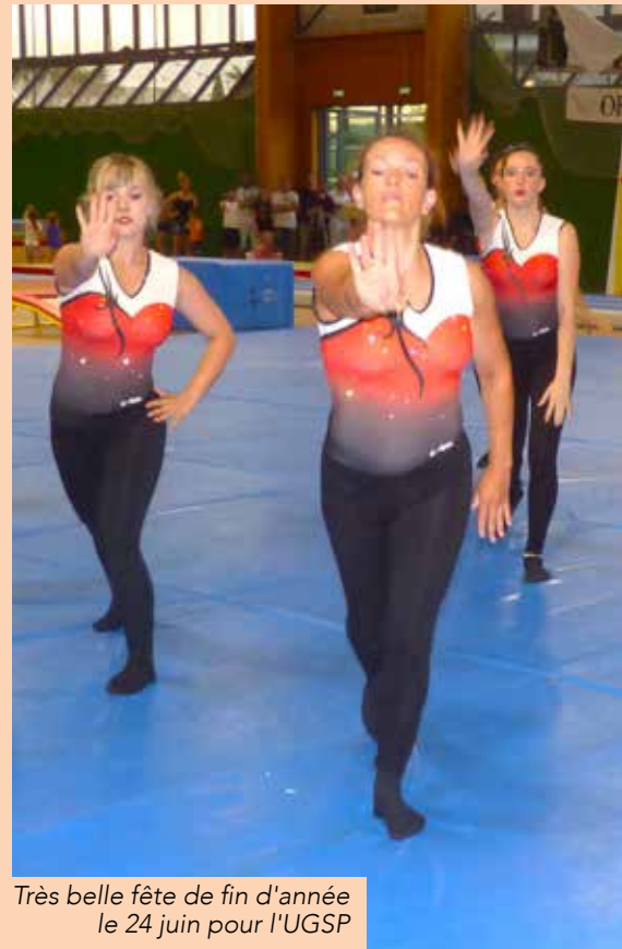
Très belle fête de fin d'année le 24 juin pour l'UGSP